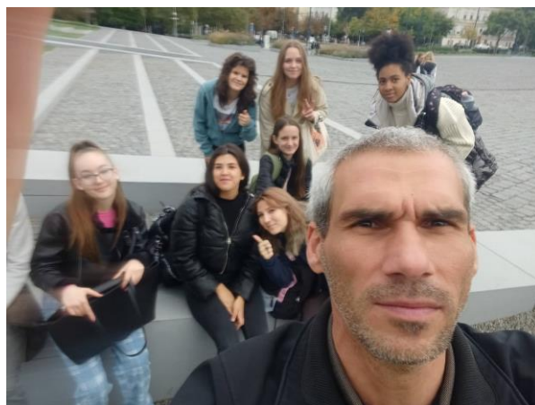
A tériszonyt leküzdő csoport

magyarságot szimbolizálják. Következő megállónk a Néprajzi Múzeum gyönyörű épülete volt. Különlegessége abban rejlik, hogy 7000 négyzetméteres tető kerttel rendelkezik. Két egymásba fonódó domboldalt idéz meg, illetve látványos a közel fél millió pixelből kialakított homlokzati díszítése. A két épület között helyezkedik el az 1956-os emlékmű. A Városligetben található még a Magyar Zene Háza, mely szintén ikonikus épület. Lyukakkal áttört tetőszerkezete és hatalmas üveg falai miatt összetéveszthetetlen más épületekkel. A Vajdahunyad vára eredetileg az Erdélyben álló megegyező vár másolata. Ma a Magyar Mezőgazdasági Múzeum otthona.