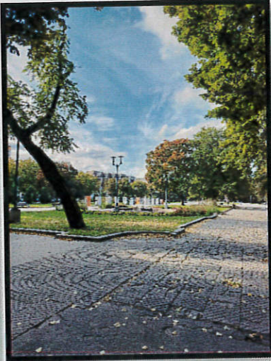
Pár kép Rigáról az első napokról, amikor megérkeztünk (az első képen a Szabadság szobor, a másodikon meg egy park látható)