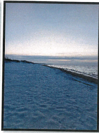
A Balti-tenger havas időben, Daugavgrívában