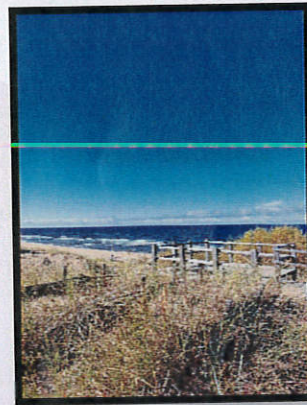
Carnikavaban a tenger (számomra ez volt az első alkalom, hogy élőben láttam egy tengert, szóval ez mindig különleges lesz)