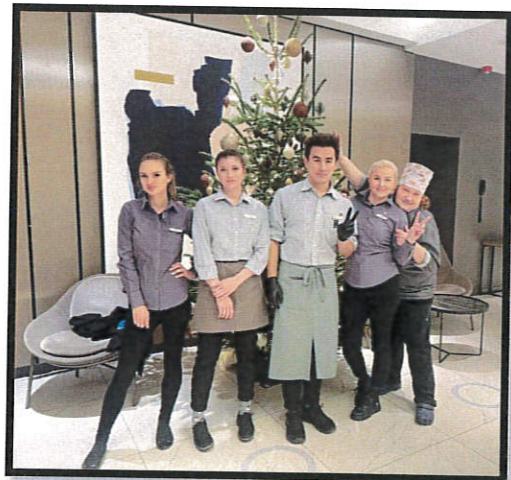
Közös karácsonyi kép a munkahelyről